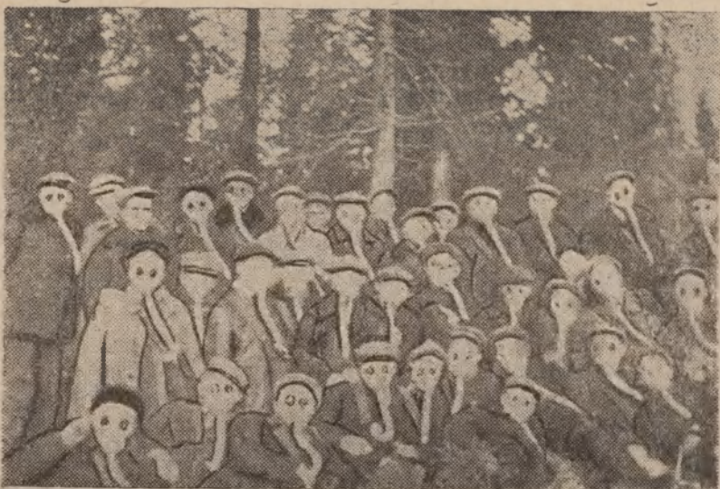
Удзельнікі фізікультурнага пахода на адпачынку